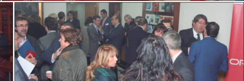
Arriba, mesas 2 y 1 de ponentes. Abajo, vista parcial de la sala y un momento del café descanso.