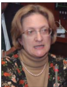
Algunos de los asistentes que intervinieron en el seminario.

dadana del Ayuntamiento de Alcobendas, describió el anterior mapa de la participación ciudadana, y la simplificación adoptada "desde la comunicación e innovación en la relación con el ciudadano".