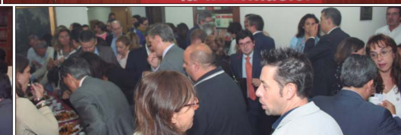
Arriba, mesas 1 y 2 de ponentes. Abajo, vista parcial de la sala y un momento del café descanso.