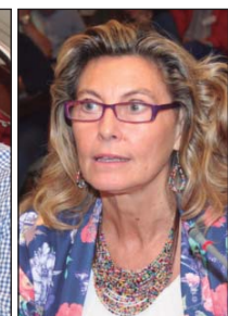
Algunos de los asistentes que participaron en el seminario mediante preguntas o comentarios sobre su propia experiencia.

bada en julio pasado, y a los buenos resultados de la Comisión Interdepartamental formada al efecto.