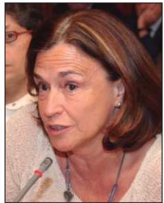
Algunos de los asistentes que participaron en el turno de preguntas y opiniones. Abajo, un momento del café descanso.