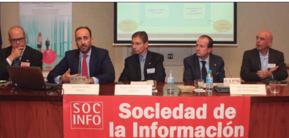
Mesas segunda (izquierda) y primera de ponentes.