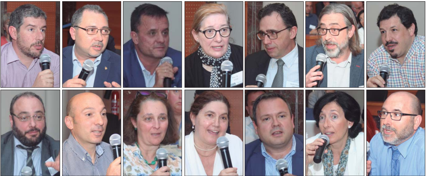
Algunos de los asistentes que participaron en el seminario mediante preguntas o comentarios sobre su propia experiencia.

herramientas para centrarnos en las personas y transformar la organización".