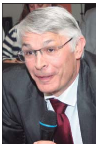
Algunos de los asistentes que participaron en el seminario con preguntas o comentarios.