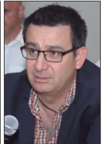
Algunos de los asistentes que participaron mediante preguntas o comentarios.