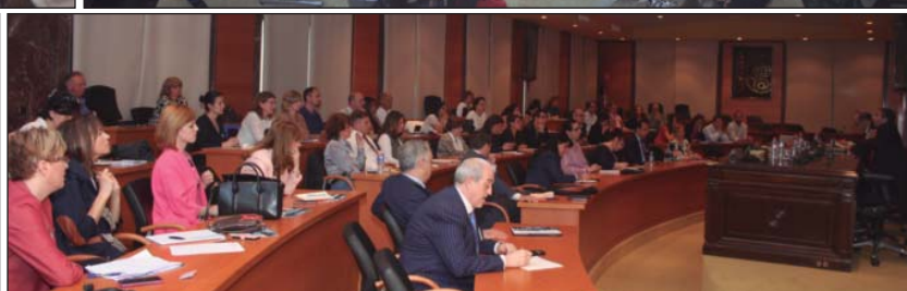
Arriba, mesas 1 y 2 de ponentes. A la derecha, café descanso y vista parcial del público asistente.