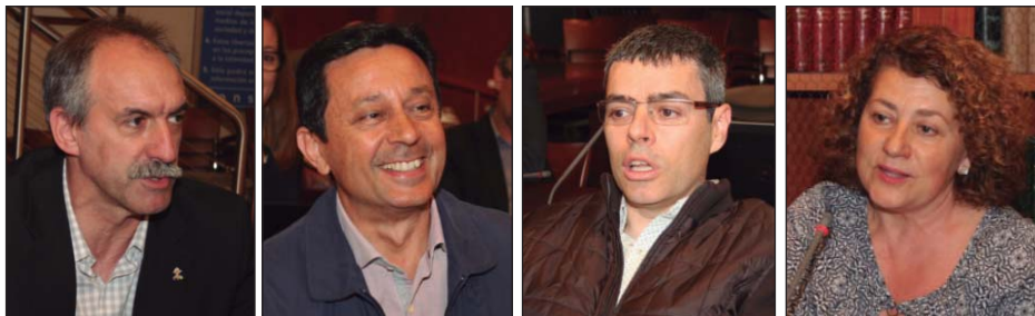
Algunos asistentes que tomaron la palabra para preguntas o exponer experiencias.