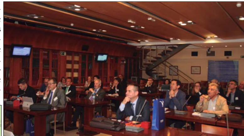
Vista parcial del público y un momento del café descanso.