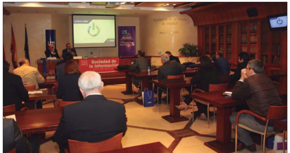
Vista general de la mesa de ponencias.