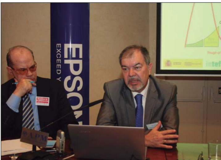
Detalle de la mesa de ponencias.