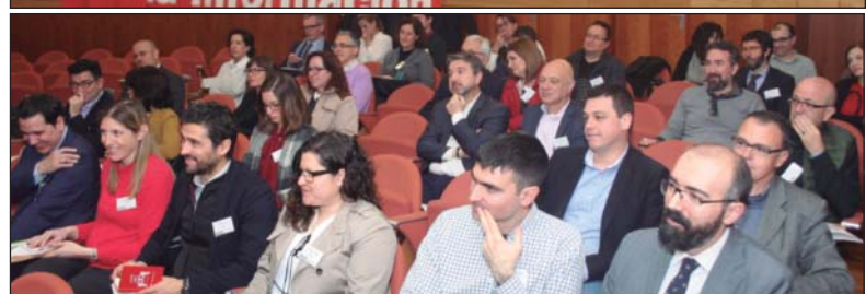
Arriba, mesas 1, 2 y 3 de ponentes, y aspecto parcial del público asistente.